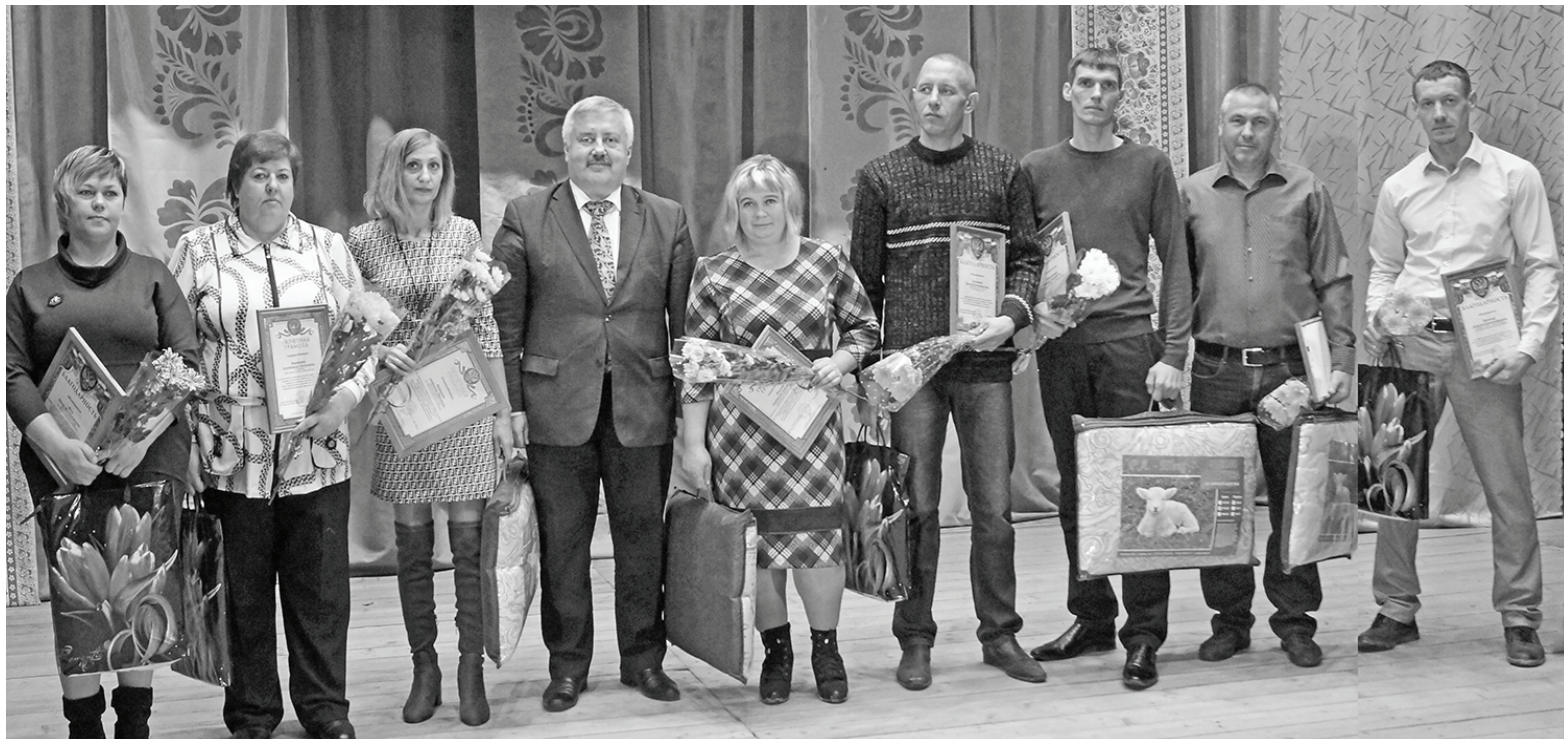
Награды - профессионалам.

Официальная дата Дня работников сельского хозяйства и перерабатывающей промышленности — третье воскресенье октября. Но мы обычно отмечаем этот праздник на пару недель позже, потому что так удобнее для земледельцев: к концу месяца они завершают уборку урожая, и у них есть время на отдых.